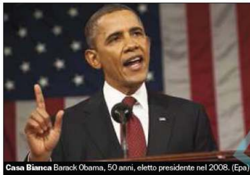
Casa Bianca Barack Obama, 50 anni, eletto presidente nel 2008.

Un'America più giusta, "costruita per durare". Un'America dove ogni imprenditore che rischia possa aspirare a diventare il nuovo Steve Jobs. E soprattutto dove i ricchi paghino più tasse, per investire di più in istruzione, sanità, ricerca. Ecco la sfida che il presidente Usa Barack Obama ha lanciato ieri agli americani nel discorso sullo Stato dell'Unione davanti al Congresso, a dieci mesi dalle elezioni presidenziali. Oggi l'America è più forte che nel 2008, ha aggiunto, anche se la grande sfida resta "mantenere vive le promesse". Il presidente ha parlato per poco più di un'ora e ha tirato fuori una grinta da campagna elettorale. Nel mirino i rivali repubblicani. "Mi opporrò a ogni tentati-