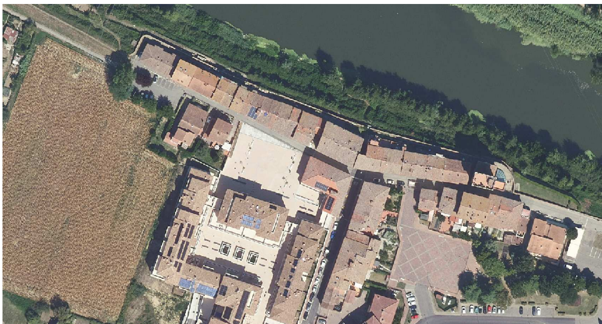
Ortofoto area di intervento