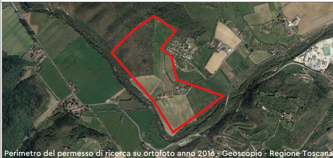
Perimetro del permesso di ricerca su ortofoto anno 2016 - Geoscopia - Regione Toscana

Ordine dei Geologi della Toscana n° 1460