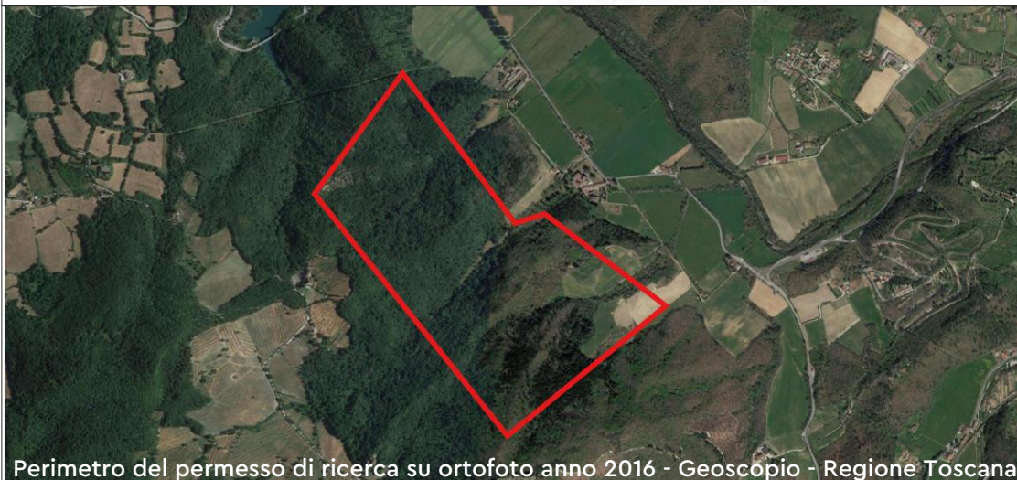
Perimetro del permesso di ricerca su ortofoto anno 2016 - Geoscopia - Regione Toscana

Ordine dei Geologi della Toscana n° 1460